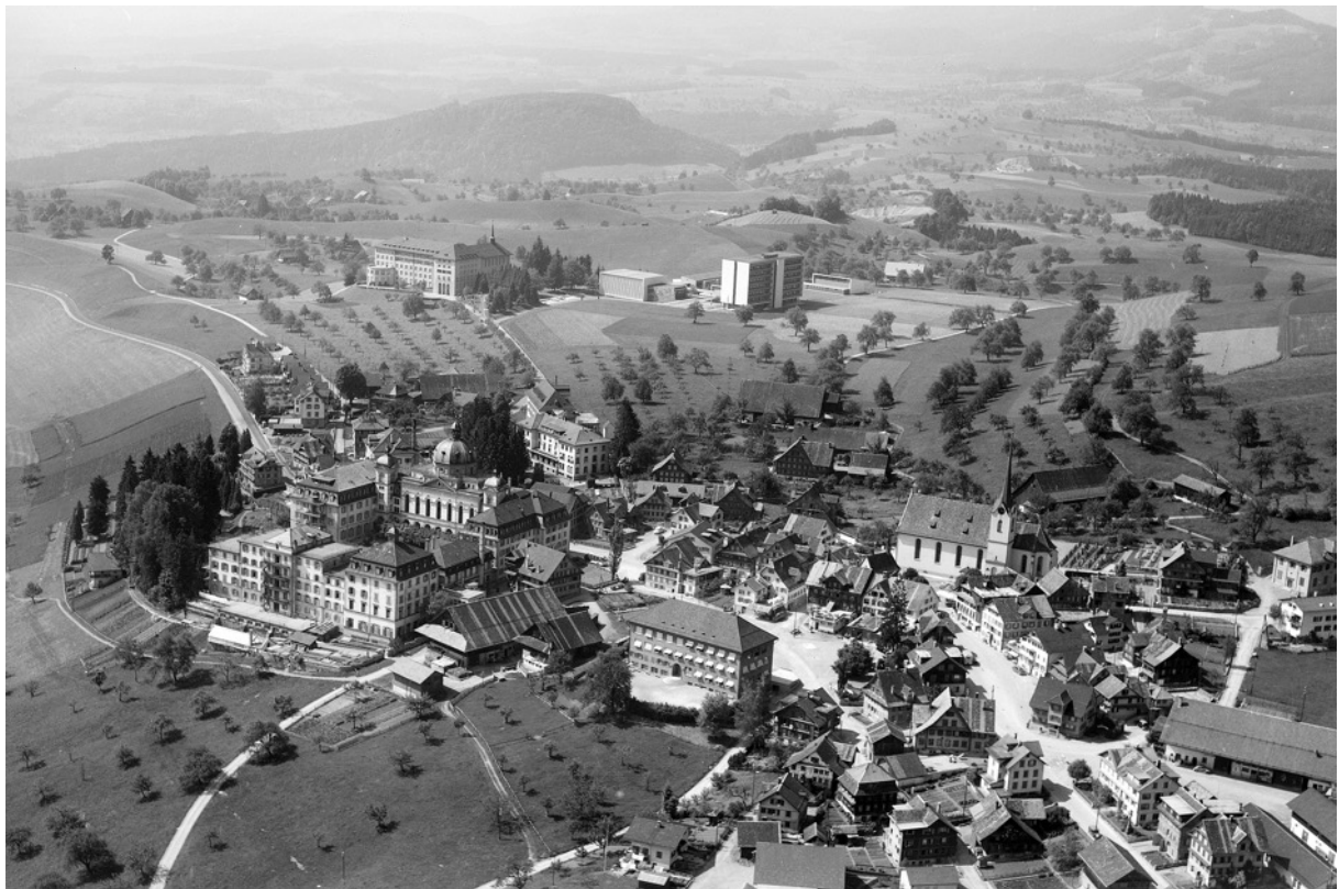
Das Ortsbild von Menzingen ist geprägt von Bildungsbauten. Flugaufnahme, 1959.

Menzingen, die "Gemeinde am Berg", ist ländlich geprägt und wartet mit einer malerischen Landschaft auf. Hier sind die Einblicke lieblich, die Ausblicke herrlich und hier entwickelte sich Grosses: frühe Bildung für alle und zwar insbesondere auch für Mädchen und junge Frauen. So baute Menzingen seit der Mitte des 19. Jahrhunderts eine unvergleichbare Bildungslandschaft auf.