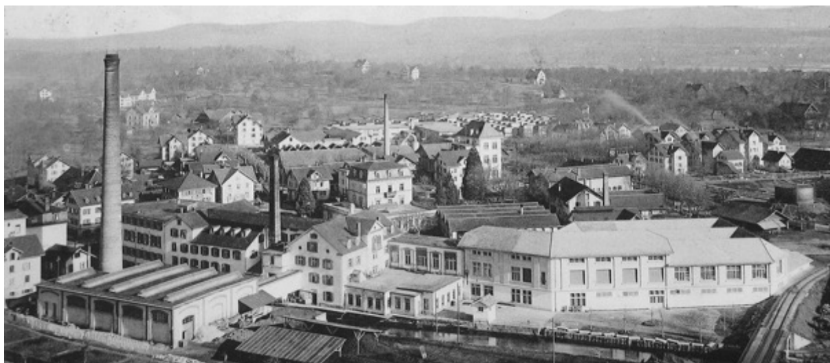
Fabrikkomplex der Anglo-Swiss Condensed Milk Company in Cham, undatiert

Der «Verein Industriepfad Lorze Zug» wurde 1994 gegründet, um das Verständnis für Industriekultur zu wecken. Er vermittelt die Zuger Industriekultur unter anderem mit dem Industriepfad Lorze. Dieser Lehrpfad entlang des Flusses Lorze enthält insgesamt 70 Stationen, die auf einer Länge von rund 30 Kilometern die Geschichte der Industrialisierung im Kanton Zug erklären. Der Industriepfad beginnt in Unterägeri und führt über Baar und Cham bis zum Kloster Frauenthal. Auf unserem Spaziergang nehmen wir uns den Abschnitt in Cham vor.